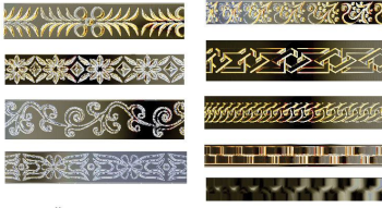
Profil Örnekleri/ Profile examples