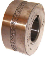
Gravür örnekleri/ Engraving examples